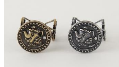
ポットモチーフリング (GR645X02) ¥2300+tax A ゴールド、A シルバー