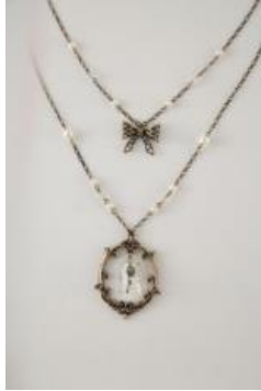
バラ額縁 2way ネックレス (GR643X05) ¥3900+tax A ゴールド、A シルバー