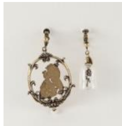
額縁シルエットイヤリング (GR642X04) ¥2900+tax A ゴールド、A シルバー