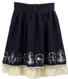
クラシックローズ刺繍SK (TS281X96Y) ¥4900+tax 生成り、イエロー、紺