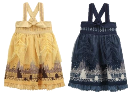
クラシックローズリボンOP (TS344X04KO) ¥5900+tax イエロー、紺